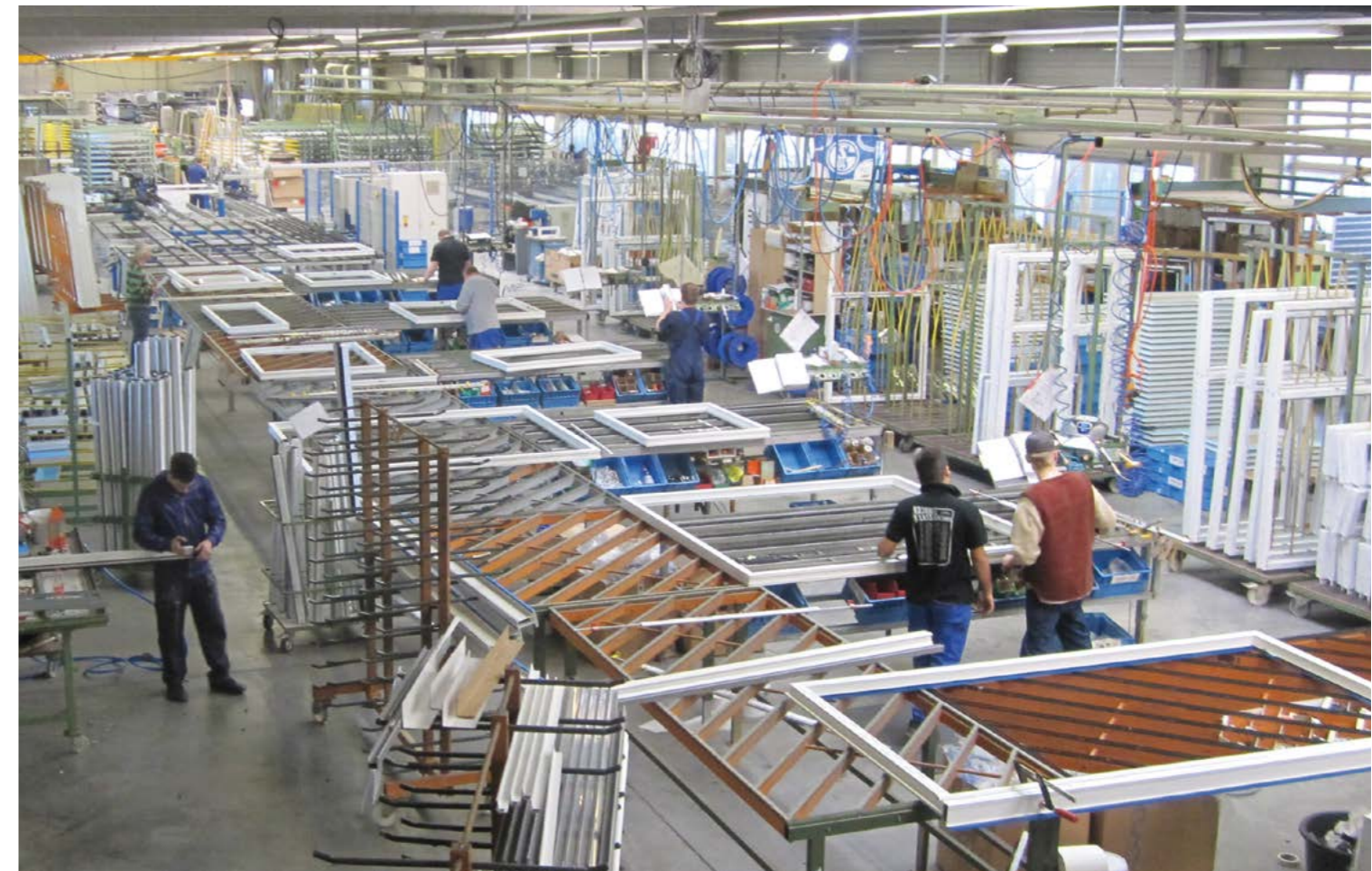
OLIVA-Mitarbeiter in der großen Produktionshalle am Standort Marl

Mit Stolz können wir sagen, dass große Projekte, wie z. B. Hotels, Wohnanlagen und Industrieparks, erfolgreich abgewickelt wurden. Das ist auch für zukünftige Projekte unser Anspruch.